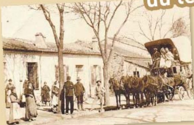
Bureau de Bertville - Département d'Alger

Contact et inscription jusqu'au mercredi 14 mars à 14 h auprès de josiane.foynat@laposte.fr / 01 55 44 01 51 Siège du Groupe La Poste - 44 boulevard de Vaugirard - 75015 Paris