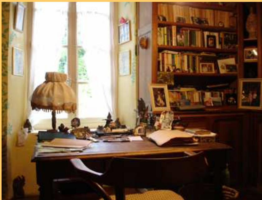
Le bureau d'Eugène Vaillé à Riols

Homme d'archives et de textes, les premières productions d'Eugène Vaillé – outre sa thèse de droit soutenue en 1901 – s'intéressent au fonctionnement des institutions postales en France et en Europe.