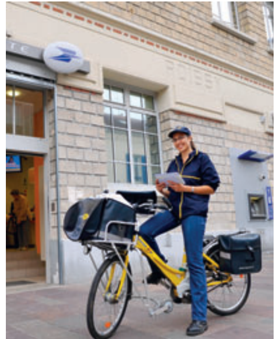
Vélo à assistance électrique.

60 000 FACTEURS FORMÉS À L'ÉCOCONDUITE (CHIFFRE À LA FIN 2009) AVEC POUR OBJECTIF D'ÉCONOMISER, CHAQUE ANNÉE, 5 MILLIONS DE LITRES DE CARBURANT ET DE REJETER 10 000 TONNES DE CO 2 EN MOINS.