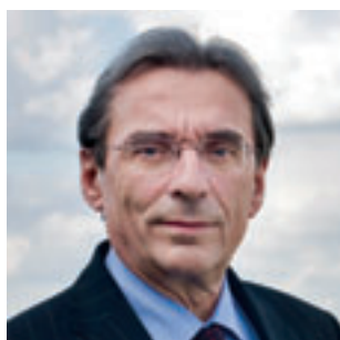
Roland Ries, Maire de Strasbourg

Strasbourg | Fin avril 2010, le VHR, véhicule hybride rechargeable, est présenté à Strasbourg. Une flotte d'une centaine de véhicules sera testée par des entreprises ou collectivités durant les trois prochaines années.