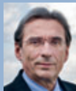
Roland Ries, Maire de Strasbourg Expérimentation des véhicules hybrides rechargeables