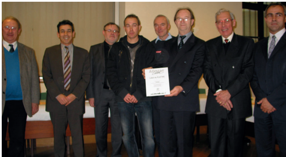
Chevaigné reçoit le premier label "Adresse" de Platine le 10 décembre 2010, à l'occasion de la signature de la charte entre le SDIS 35 et La Poste.

97 611 foyers d'Ille-et-Vilaine, soit 26,9 % sont considérés comme ne bénéficiant pas d'une adresse complète 20 communes ont signé la charte