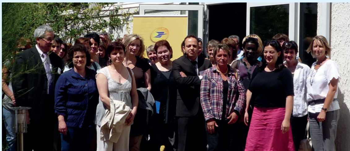
36 gérants d'Agences Postales Communales et maires ont participé à la réunion annuelle de la Vienne.

La Poste de Charente et Vienne renforce son accompagnement auprès des maires dans la gestion de leurs Agences Postales Communales (APC).