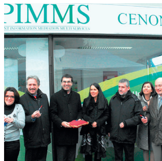
Le PIMMS de Cenon (33) a été inauguré en décembre 2010 par les opérateurs de service public et le maire de Cenon.