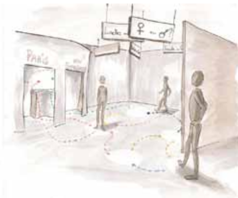
Elodie Teixeira - Dans la peau du courrier