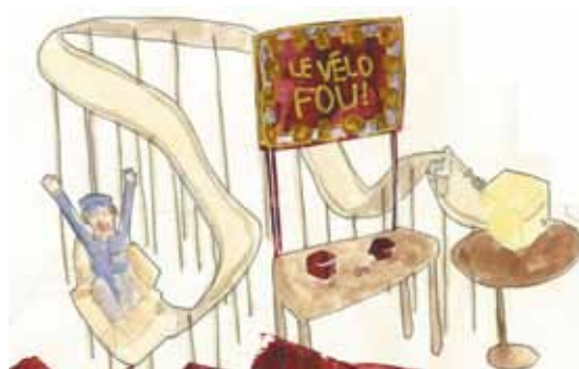
Lauriane Vigouroux - Poste-Land