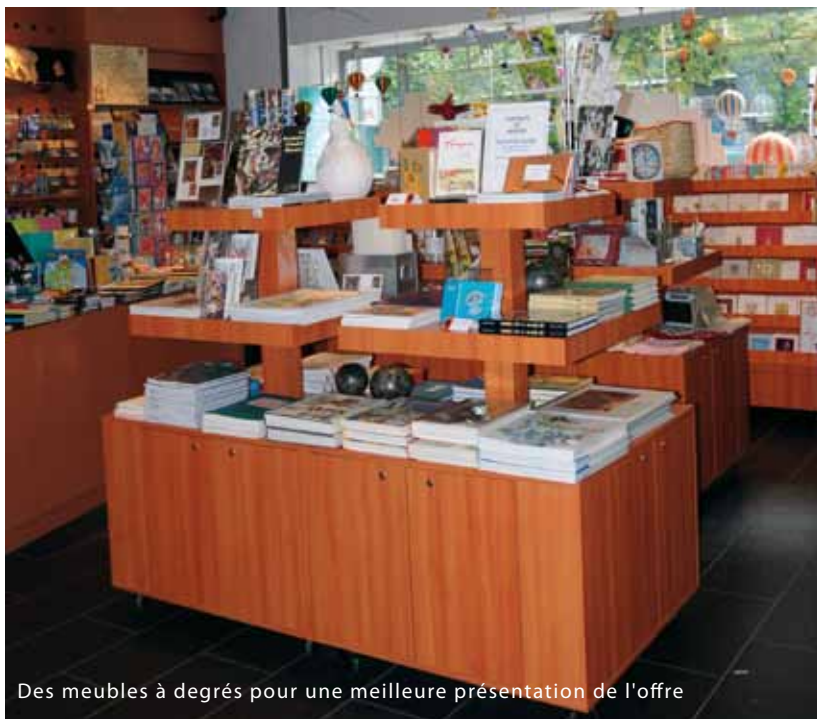
Des meubles à degrés pour une meilleure présentation de l'offre