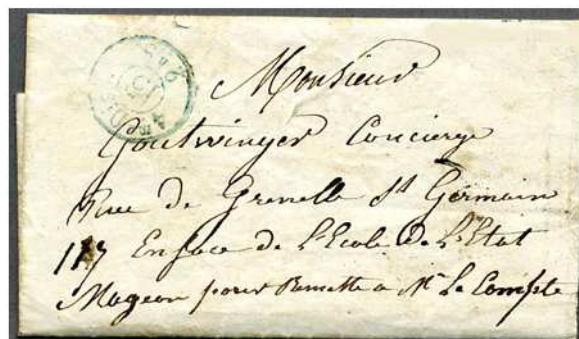
Mairie du 7 e arrondissement (Inv. 17262/9)

La typologie des lieux de détention peut être partiellement expliquée : les barrières sont les lieux où ont été arrêtés les fuyards et ceux qui venaient participer au soulèvement, les casernes pour les déserteurs et les dépôts, les mairies et les hôpitaux pour les militaires ralliés à l'insurrection. Tous ces lieux ne sont que des centres de transit, avant libération – fautes de preuves – ou transfert vers une autre prison.