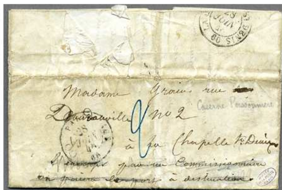
Caserne Poissonnière (Inv. 17262/6)

Près de 80 centres de détention sont connus à ce jour ; une vingtaine est répertoriée par les courriers de la collection Boussac. Géographiquement, ils se situent dans Paris et sa banlieue, en région parisienne ou dans les ports. La nature des lieux de détention est multiple : barrières (dans les pavillons de l'octroi), casernes, dépôts (commissariat ou poste de police), forts, mairies, prisons, hôpitaux et pontons.