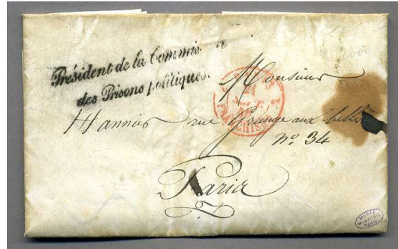
Griffe linéaire du Président de la commission des prisons politiques utilisée pour expédier en franchise un courrier d'un prisonnier adressé à ses parents (Inv. 17262/34)