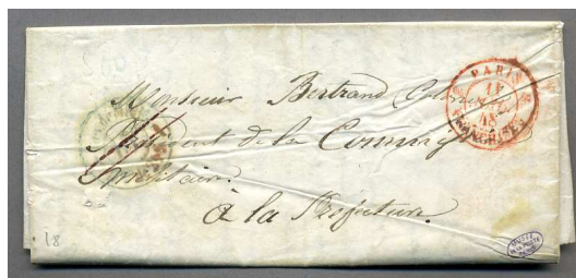
Pli adressé au général Bertrand (Inv. 17262/24)